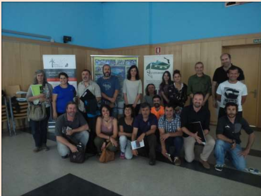
Profesionales del ecoturismo, al finalizar la reunión de trabajo. (08/06/2016)