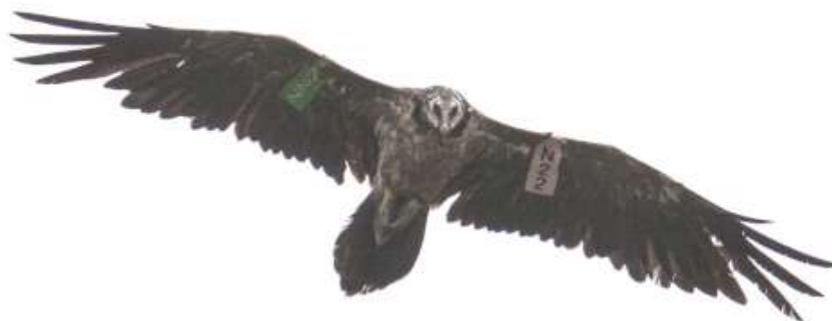
'Atilano' (2012) muestra ya un plumaje de subadulto, con cabeza clara y collar todavía visible. Se le observa con frecuencia por el área de liberación interaccionando con sus conespecíficos, y también visita regularmente el comedero del Mirador de la Reina (magen tomada el 27/06/2016)